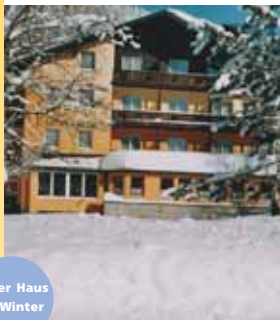
Unser Haus im Winter